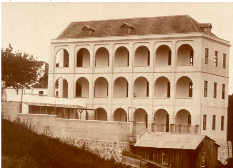
Figura 1- Colégio Anchieta (1918)