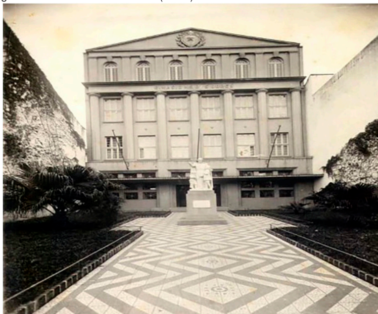
Figura 2- Colégio Nossa Senhora das Dores (1938)