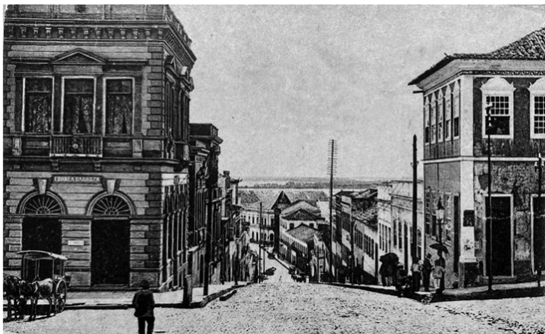
Figura 3- Liceu Don Afonso, sobrado à direita (s/d)

Feitas essas considerações sobre os dados das escolas, o propósito, agora, é avançar na discussão sobre elas. O Liceu Dom Afonso (figura 3) foi a primeira escola pública de instrução secundária na Província, que, a partir de 1859, ocupou o espaço superior de um sobrado, onde hoje se localiza a Biblioteca Pública do Estado do Rio Grande do Sul (Arriada, 2007). No entanto, por ser um sobrado com atividades comerciais no térreo, não era considerado um lugar adequado para escolas e, diante disso, construiu-se o primeiro prédio com verbas do Governo da Província para abrigar essa instituição de ensino (Schneider, 1993; Arriada, 2007). Este edifício, que estava localizado na Rua da Igreja, atual Duque de Caxias, esquina com a Rua da Bragança, atual Marechal Floriano, sediou o Liceu D. Afonso, extinto em 1871 e substituído pelo Ateneu Rio-Grandense (figura 4), também extinto em 1873 8 . Anexo ao Liceu, estabeleceu-se a Escola Normal de Porto Alegre neste mesmo edifício, em 1872.