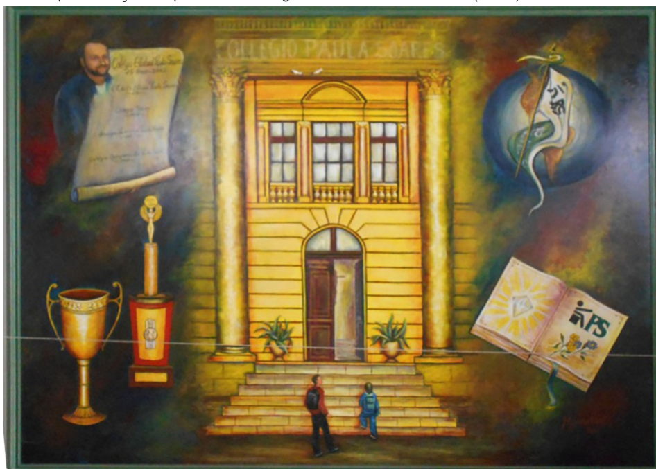
Figura 9- Representação do pórtico do Colégio Estadual Paula Soares (2023)

No hall de entrada do edifício, há uma pintura em comemoração aos 75 anos da instituição, ou seja, desde que passou a funcionar de forma independente à Escola Complementar, no ano de 1927. Conforme podemos visualizar na figura 9, temos a representação do suntuoso pórtico de entrada e dois estudantes, uma folha onde consta os diferentes nomes da instituição, troféus e símbolos demonstram uma tentativa de rememorar, de perpetuar nas paredes da escola a sua longa trajetória.