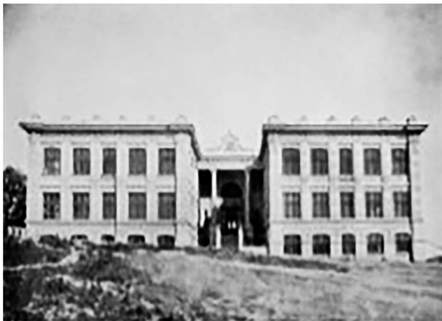
Figura 5- Colégio Elementar Fernando Gomes (1922)