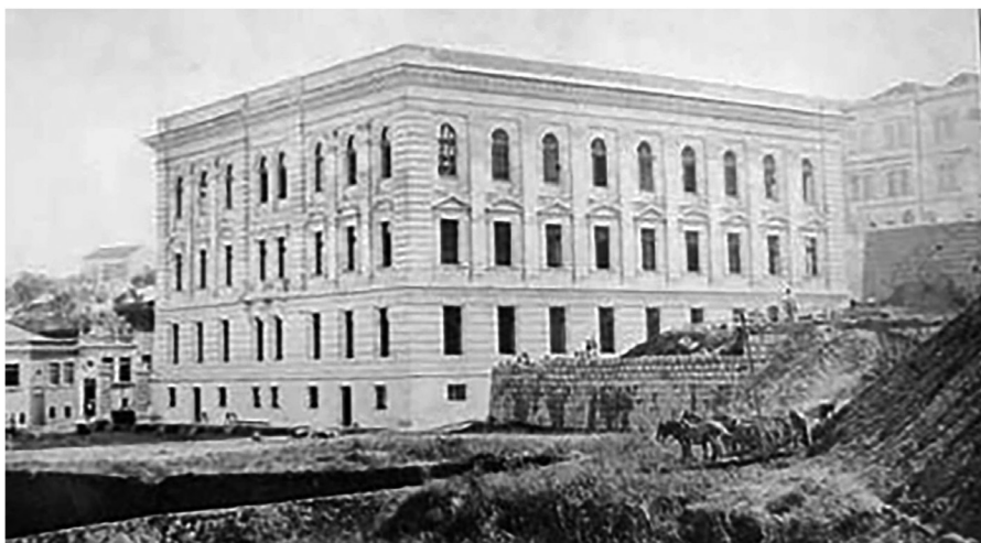
Figura 6- Escola Complementar de Porto Alegre/RS (1922)