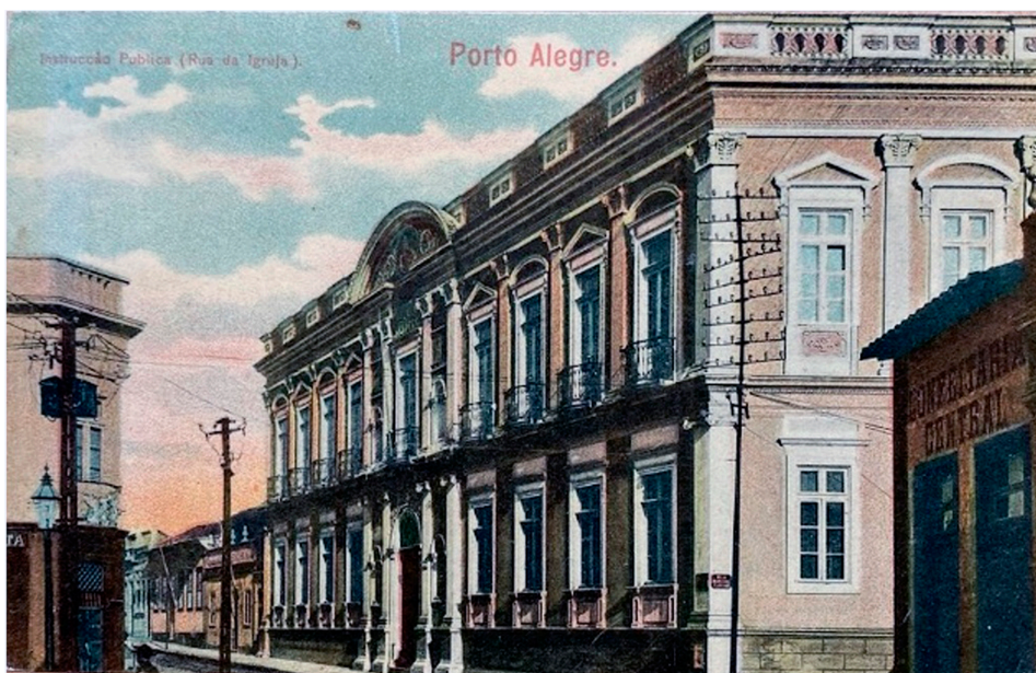
Figura 4- Atheneu Rio-grandense e Escola Normal de Porto Alegre (s/d)