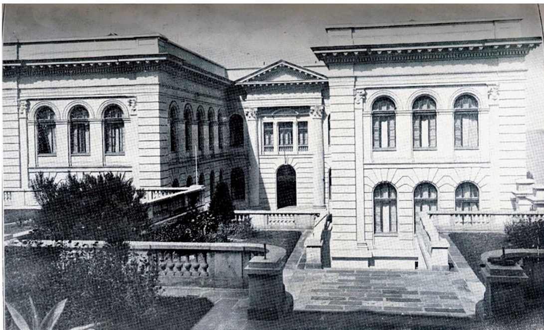
Figura 7- Escola Complementar - curso elementar anexo (1924)