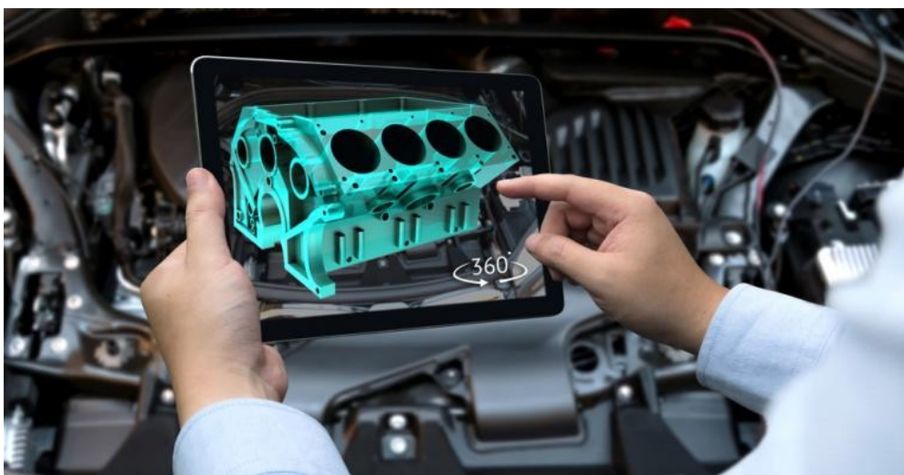
Figura 2. Uso de tablet na realidade aumentada.

Assim, a realidade aumentada é utilizada para complementar o mundo real com componentes virtuais, fazendo objetos físicos e objetos virtuais coexistirem no mesmo espaço do mundo real (Lopes, Vidotto, Pozzebon, & Ferenhof, 2019).