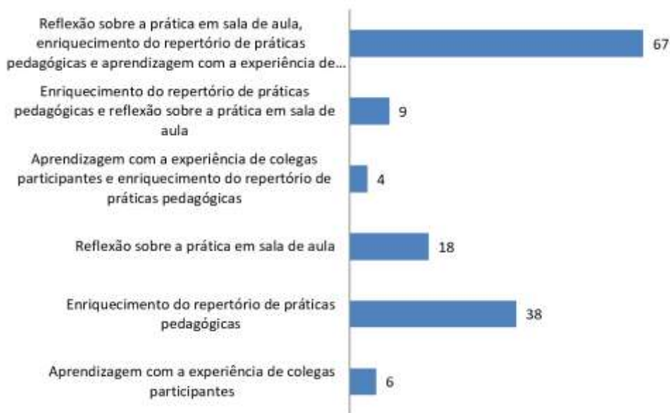
Figura 4. Contribuições dos programas de formação continuada voltados à alfabetização.

Embora Chartier (2010) defenda que os professores utilizem os saberes teóricos em suas práticas de forma natural, por estarem impregnados naqueles/daqueles que compõem a ordem do dia, os dados desta investigação revelam que a percepção dos professores que integram este corpus aponta para a relação entre teoria e prática a partir da formação continuada, conforme Figura 4.