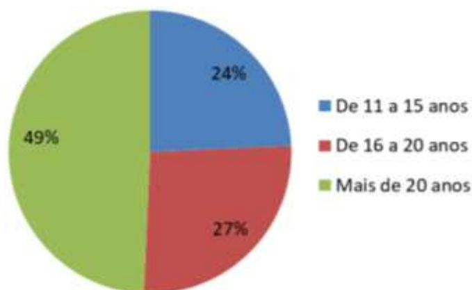
Figura 1. Tempo de experiência no magistério.

Os saberes-fazeres que integram esta categoria de análise dizem respeito àqueles construídos na formação docente, inicial e/ou continuada, bem como aqueles construídos na prática, os quais Chartier (2000) nomeia de saberes ordinários. Para tanto, neste estudo, consultamos o tempo de experiência no magistério, o grau de escolaridade e a participação em cursos de formação continuada voltados à alfabetização nos últimos 15 anos como constituintes dos saberes-fazeres dos professores alfabetizadores das turmas de 1º ano do Estado de Alagoas. Tomando por base a resposta dos 144 sujeitos que compõem este corpus de análise, a Figura 1 apresenta o tempo de experiência deles.