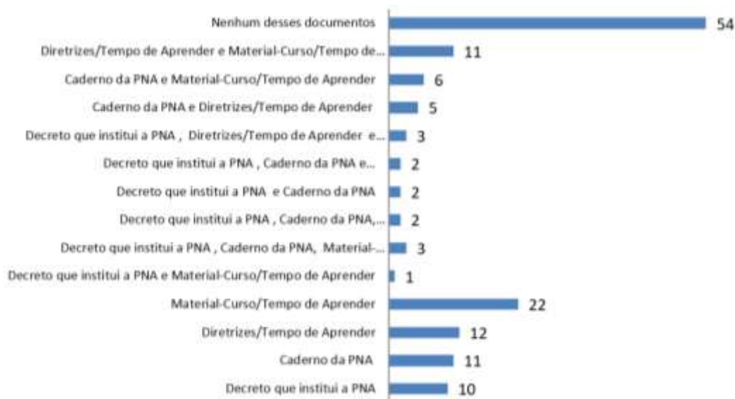
Figura 5. Documentos sobre a PNA que os alfabetizadores conhecem.

Embora a PNA afirme propor a adesão voluntária dos municípios, os quais têm por competência a oferta de educação infantil e ensino fundamental, 70 professores disseram ter havido alguma discussão na(s) escola(s)/rede(s) que atuam. Desse modo, os dados revelaram que, do corpus em análise, 90 professores afirmaram conhecer a Política Nacional de Alfabetização do atual governo, perfazendo, portanto, o percentual de 62,5%. Quando inqueridos sobre o que conheciam da PNA, os professores apontaram os documentos/diretrizes que tiveram acesso, de acordo com a Figura 5.