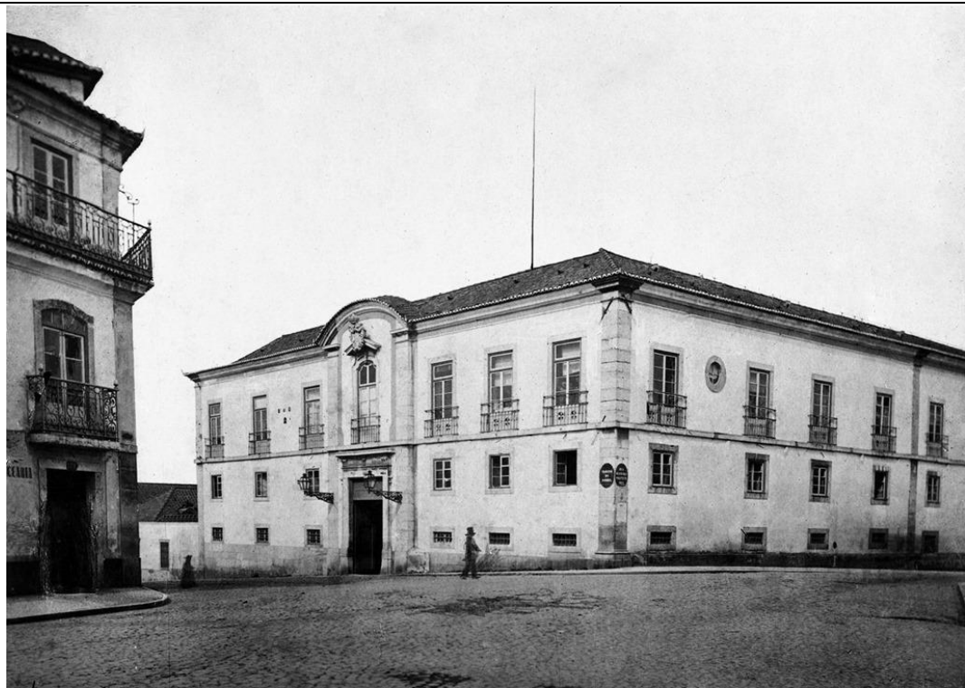
Fotografia 1. Aula do comércio, 1759-1768. Edifício da aula do comércio no período de 1 de setembro de 1759 a dezembro de 1768: Palácio dos Soares de Noronha. (A casa da aula do comércio estava instalada no piso térreo – rés-do-chão.) Ano da fotografia: 1894.

Palácio dos Soares de Noronha. Ano: 1894. Antigo edifício da Imprensa Nacional (demolido em 1904).