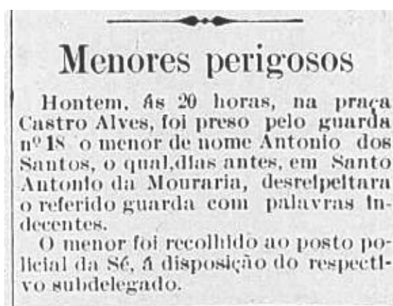
Figura 1. Recorte da 1ª página do Jornal Gazeta de Notícias da Bahia (1914).

Notícias criminais protagonizadas por menores nas capitais brasileiras, como as a seguir, eram corriqueiras na imprensa brasileira no início do século XX. No ano de 1914, o Jornal Gazeta de Notícias da Bahia, estampou em sua primeira página, a visão que se atribuía ao do menor que cometia delitos no espaço urbano (Figura 1).