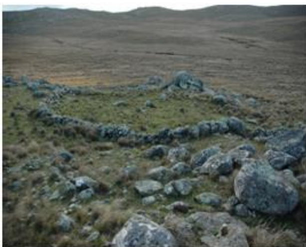
Figura 3. Estructura de piedra, Tandil

Volviendo a nuestra hipótesis, aquellas estructuras arqueológicas sobre las cuales aún hay mucho por aprender, ubicadas en áreas productivas, fueron destruidas por cuestiones que tienen que ver con lo económico, mientras que los corrales de piedra ubicados en zonas no fértiles (como las cimas rocosas de las sierras) están conservados de manera intacta.