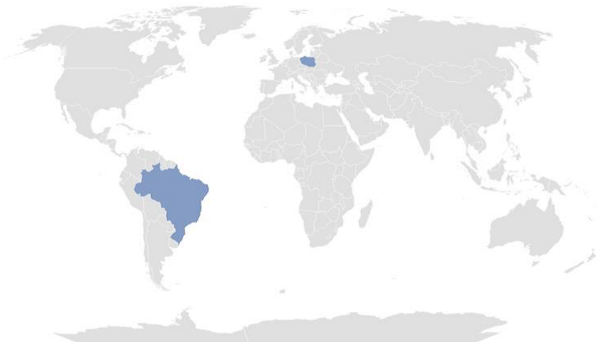
Figura 2 Distribuição quantitativa das pesquisas de acordo com o país elaborada pelos autores (2022).

De acordo com a caracterização geral dos participantes, na maioria das pesquisas houve predominância do sexo feminino e da religião católica. Ao todo, participaram das oito pesquisas 1.365 pacientes com câncer, com idades que variaram entre 18 anos e 99 anos (cf. tabela 3).