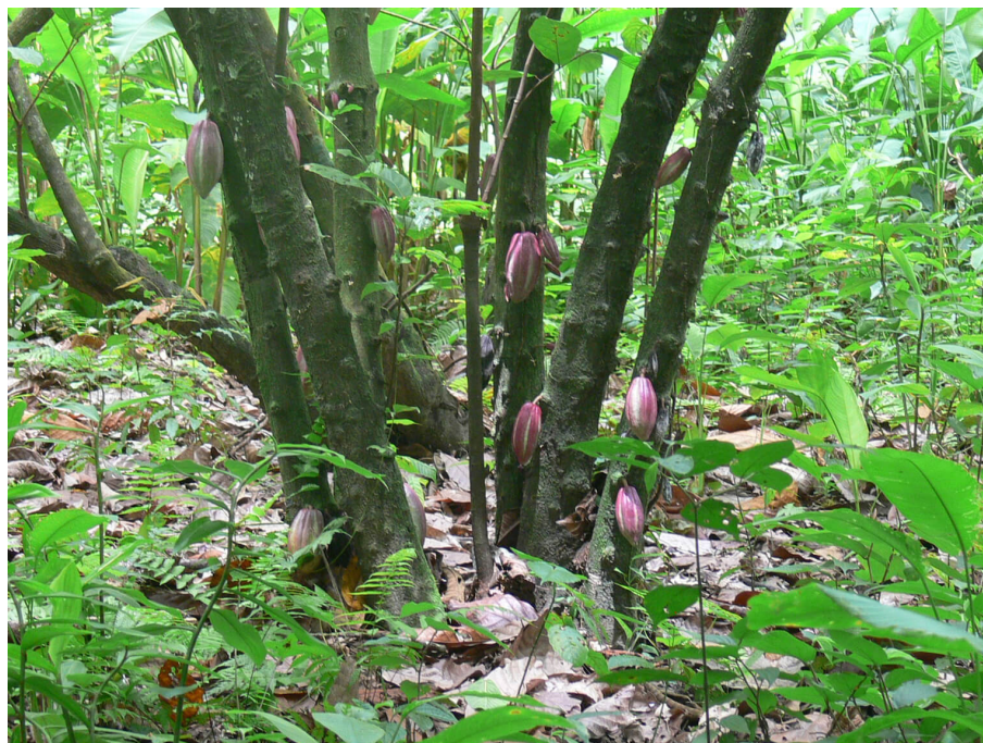
Imagen 2 Árbol de Cacao

El cacao pertenece a la familia de las Esterculiáceas, del género Theobroma , con nombre científico Theobroma cacao L., es un árbol que se produce a partir de semilla. Es un cultivo semipermanente plantado en clima cálido con elevada pluviosidad, en suelos profundos con buen drenaje, a orillas de los ríos y generalmente bajo sombra. Entre las características físicas de la planta se resalta su baja estatura (entre 3 y 8 metros), tronco sencillo de corteza áspera, hojas elípticas, ovales, grandes, de color verde claro, flores rosadas, pequeñas, distribuidas en el tronco y en las ramas (Imagen 2). El fruto del cacao, llamado comúnmente mazorca, es una drupa grande, de unos veinticinco centímetros de largo, sostenida por un pedúnculo fuerte, al madurar toma diferentes colores: rojas, anaranjadas, moradas o amarillas (Cartay, 1999; Ramos et al. , 2004).