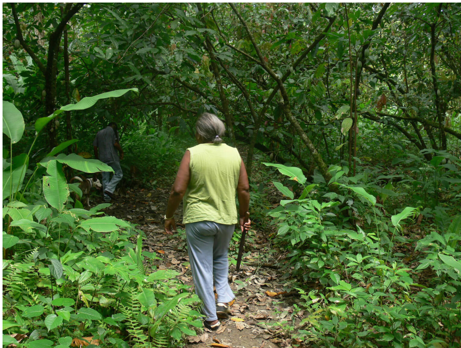
Imagen 4 Mujer cacaotera de Panaquire Fotografi#a: Maura Falconi (2013).

El cacao es muy importante, yo vivo de eso, yo sembraría cacao así tuviera trabajo, para invertir, hacer chocolate, además nos sentamos debajo de la mata a comer cacao, además me meto con mi machete y botas a limpiar y recoger el cacao, mi hermano me ayuda con el cacao, el ñame y el ocumo (Maigualida Paez, comunicación personal, Panaquire, 2012) (Imagen 4).