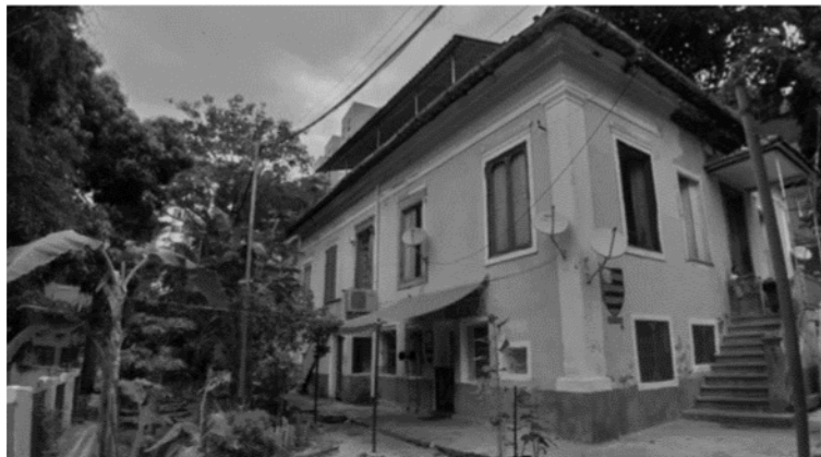
Figura 2 - Casarão da Chácara do Catumbi