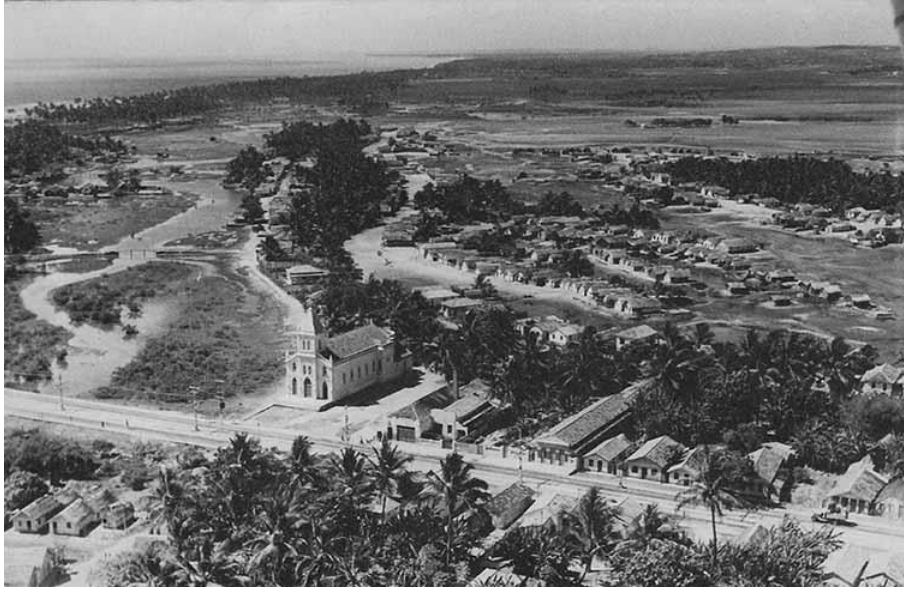
Figura 4 - Vista aérea do bairro do Pina com a Avenida Ligação e a Igreja matriz do Pina ao fundo, década de 1940