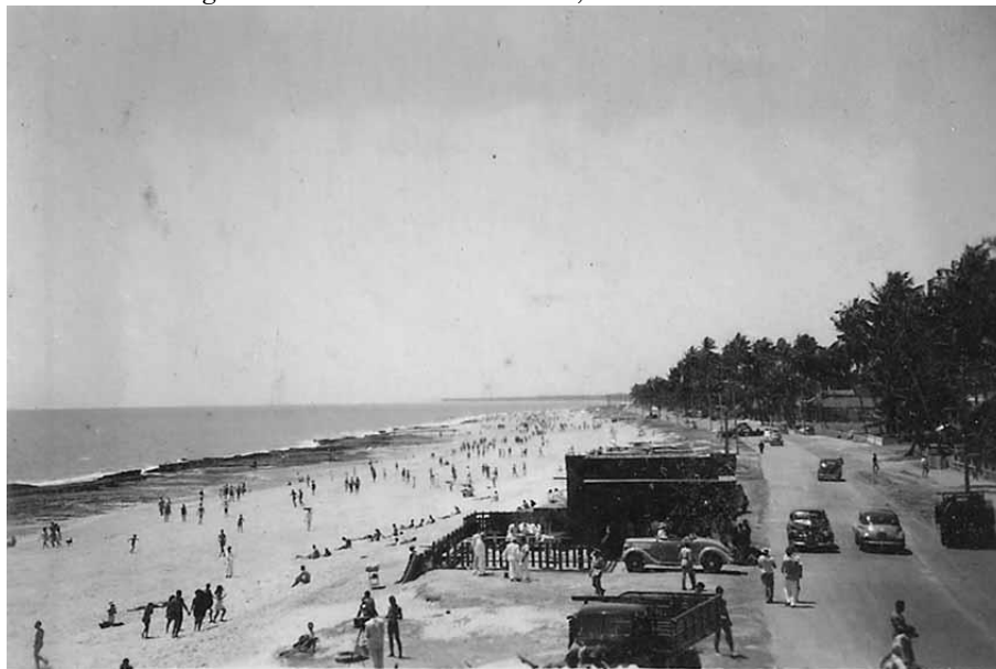
Figura 3 - Avenida Beira-mar, na década de 1940

Nas duas primeiras décadas do século XX, diversos proprietários e empreendedores, muitos dos quais detentores de terras no entorno dessas praias, pressionaram o governo para viabilizar um acesso desde o centro da cidade. Entre diferentes propostas, aquela que se materializou foi a da construção da Avenida Beira-mar (Fig. 3), que partia desde o Pina até a Igreja de Boa Viagem.