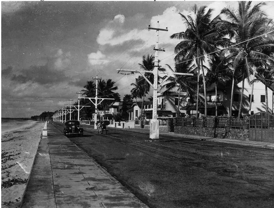
Figura 5 – Av. Beira-mar e seus palácios, década de 1940

definitivas. Nas décadas de 1930 e 40, elas já haviam tomado quase toda a linha de costa (Fig. 5).