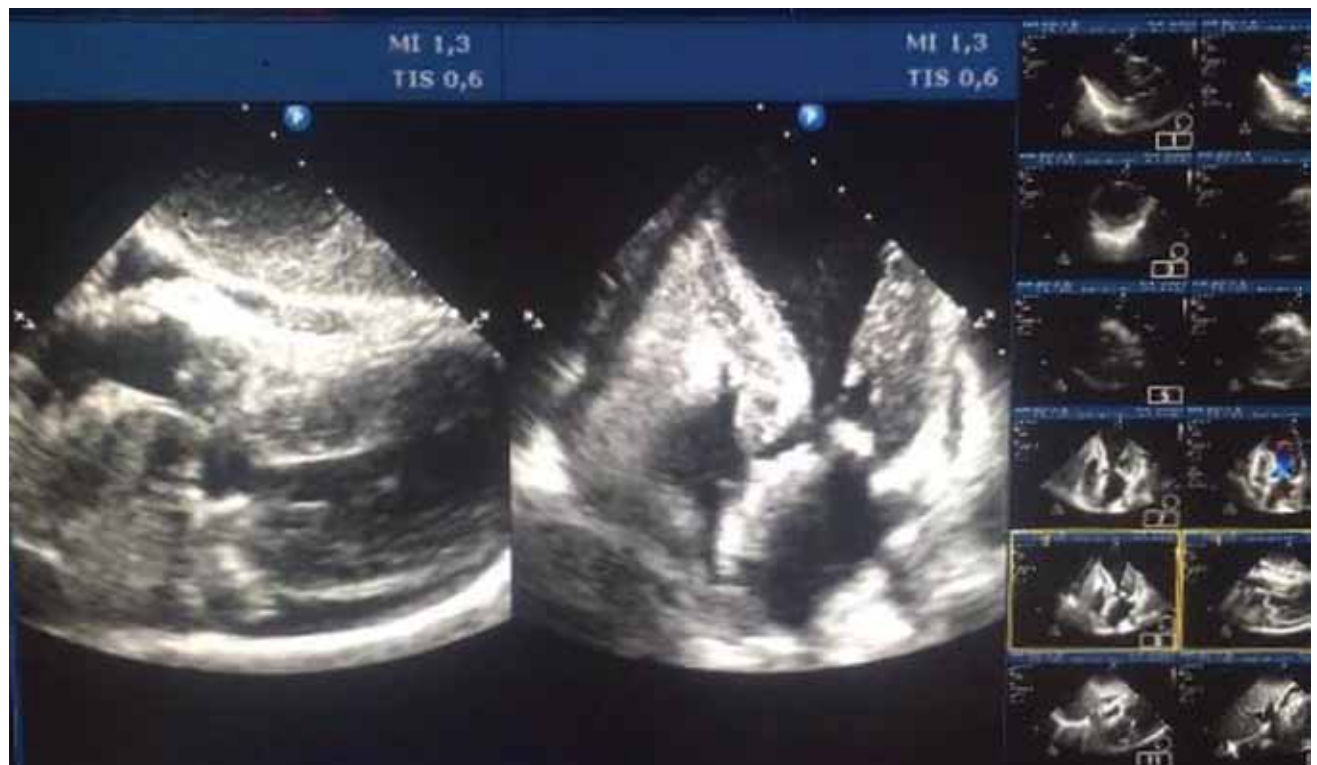
Figura 2. Ecocardiografía. Proyecciones subxifoidea y apical cuatro cámaras, donde se aprecia el clásico «balonamiento apical», derrame pericárdico severo con colapso de cavidades derechas.