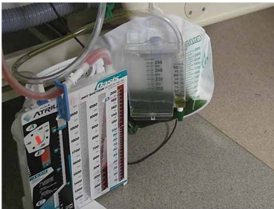
Figura 3. Cambio de coloración de la orina debido al azul de metileno.

preoperatorio de AM se vinculó con una reducción de la expresión de la vasoplejía.