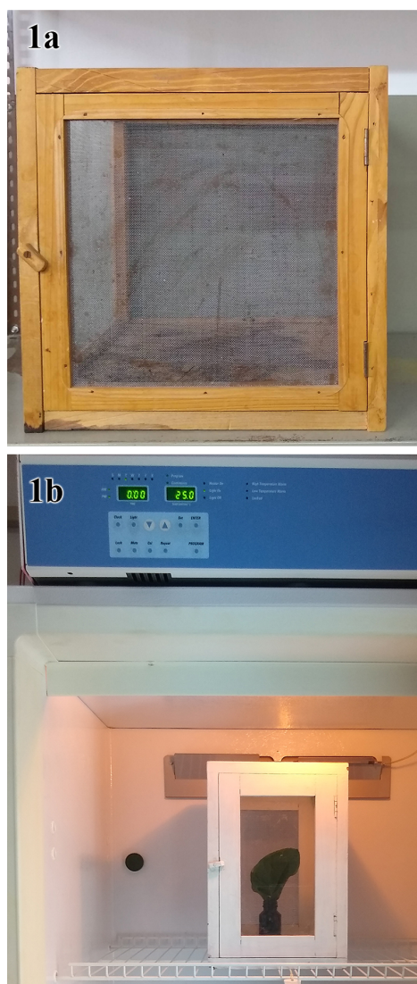
Fig. 1. Cría de Chlosyne lacinia saundersii (Doubleday) sobre Tithonia tubaeformis (Jacq.) Cass. en condiciones de laboratorio. a. Jaula de madera de 40 x 40 x 40 cm. b. Cámara de cría.