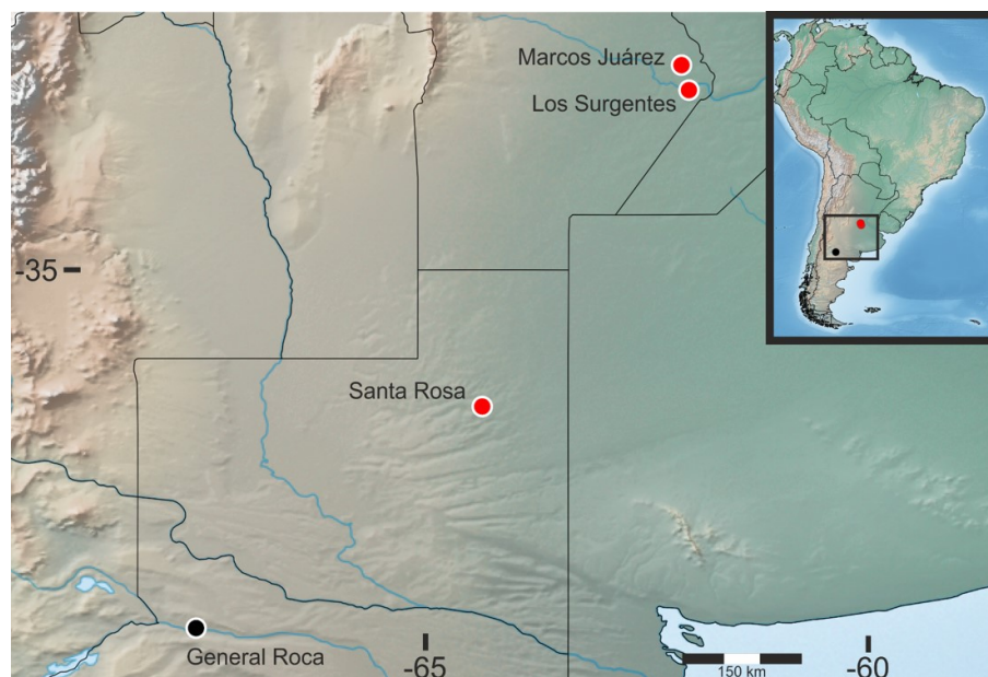
Fig. 1. Distribución conocida de Athetis rionegrensis . Punto negro=única localidad conocida previamente para la especie, puntos rojos=nuevos registros. Mapa creado con SimpleMappr (Shorthouse, 2010).

En diciembre de 2020 se colectaron larvas que se alimentaban de plántulas de soja en la localidad Los Surgentes, provincia de Córdoba (Figs. 1, 2). Se las observó actuando como cortadoras, consumiendo hojas y cotiledones. En la misma época, también se las halló en Marcos Juárez (Fig. 1, en lotes de Vicia villosa Roth. recientemente secada mediante rolo faca.