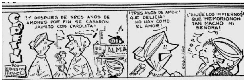
Figura 1. Copetín, El Tiempo , (tira 630611), Biblioteca Nacional de Colombia.

Lo mismo sucede con farrononón , jurgonón , grandotote y sedonón que expresan el gran tamaño de un objeto (la negrilla es nuestra y la transcripción es fiel a lo publicado en las redes sociales):