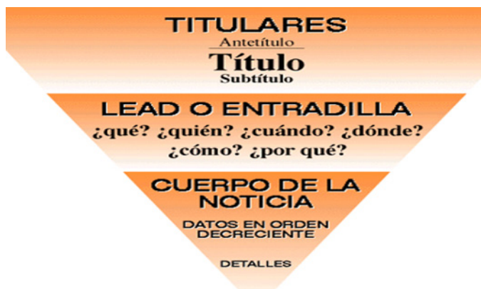
Figura 1. La pirámide invertida de la noticia