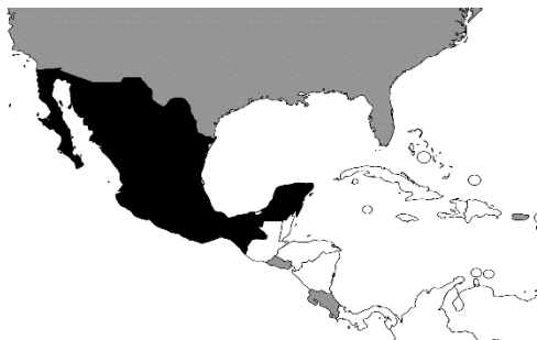
Figura 2. Distribución areal del esquema que si