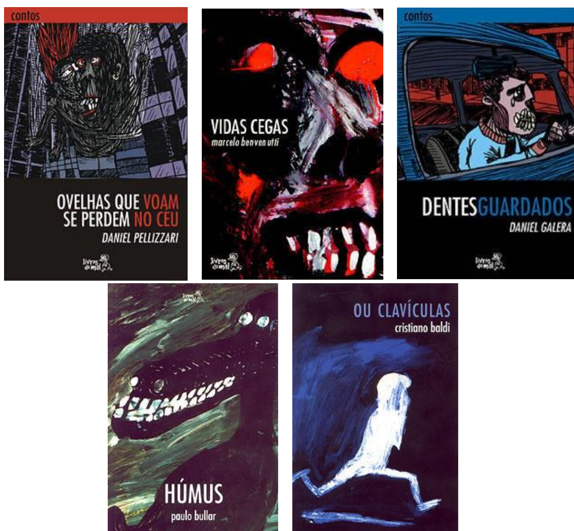
Figura 4 – Capas dos livros da Coleção Contra a Capa.