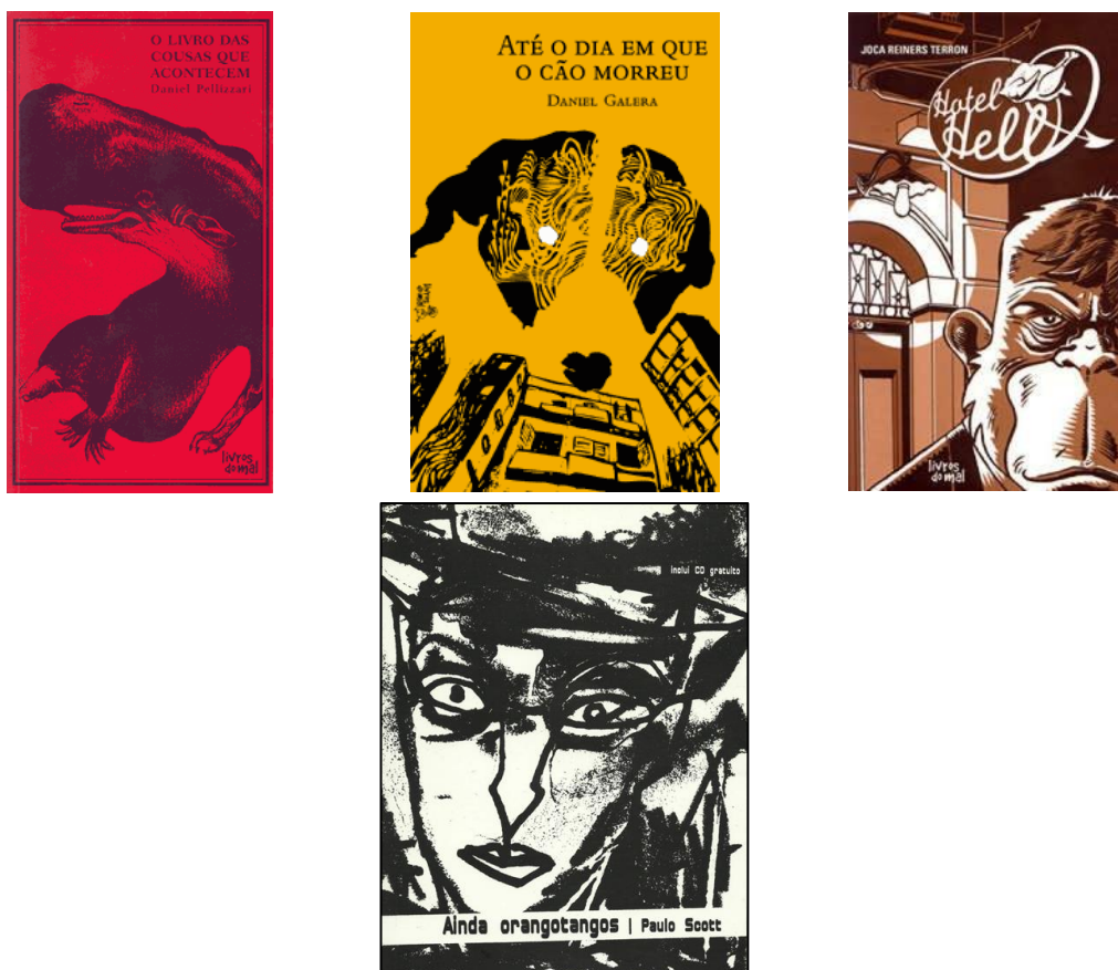
Figura 5 – Capas dos livros da Coleção Tumba do Cânone.

Para essa coleção, cada autor convidou um ilustrador para ser responsável pela arte de seu título. A qualidade e o resultado estético dessas publicações (Figura 5), que buscavam se distinguir do padrão editorial vigente, foi reconhecida pela crítica como um ponto forte da editora.