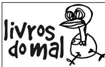
Figura 1 – Logomarca da Editora LdM, criado por Guilherme Pilla

nebuloso da internet e, de certa forma, foi reconhecida como uma renovação no perfil da literatura contemporânea nacional.