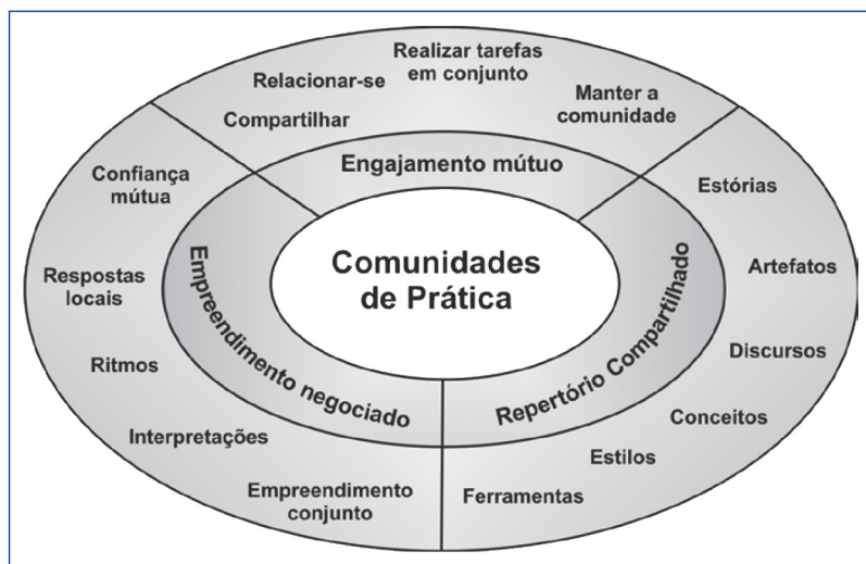
Figura 1 As 3 dimensões de uma comunidade de prática.

Fonte: Gouvêa, Paranhos e Motta (2008, p. 5).