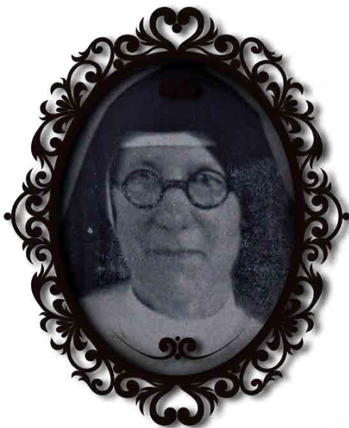
Imagen 1. Sor Honorina Lanfranco, FMA.

En 1901 fue enviada a dirigir la sede del Instituto de Cerdeña, donde tiempo después le solicitó a la superiora ser enviada a América como misionera. En Colombia se desempeñó como rectora del Colegio María Auxiliadora en los municipios de Chía, Guadalupe, Cali, Popayán y Medellín, en esta última ciudad ejerció dicho cargo en dos momentos: de 1915 a 1919 y de 1925 a 1930 10 . El período que va de 1915 a 1930 permitió a Lanfranco la producción de un conjunto de discursos, prácticas y estrategias para hacer del colegio salesiano de Medellín una institución productora de saber que permitió a la juventud femenina educarse para el ejercicio de los roles de esposa, madre y maestra; a la vez que posibilitó la institucionalización de la educación infantil como una práctica de saber, para llevar a cabo la salvación del alma de los párvulos.