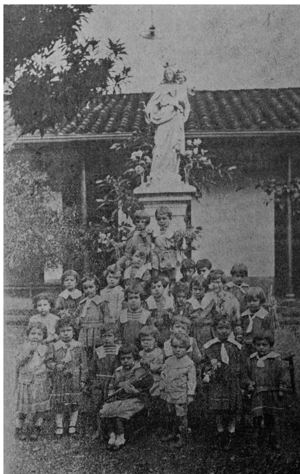
Imagen 2. Grupos de niños del kindergarten n° 2. Colegio María Auxiliadora.

La segunda tensión se produjo con una parte de la sociedad paísa 45 , que no veía con buenos ojos la educación de los párvulos por fuera del hogar: «nuestro primer kínder tuvo que luchar con el ambiente y críticas de las autoridades y de la sociedad de entonces, que no admitían el ingreso de los