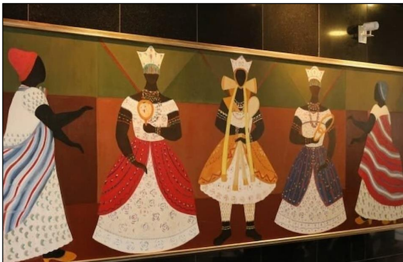
Figura 09 Quadro Orixás