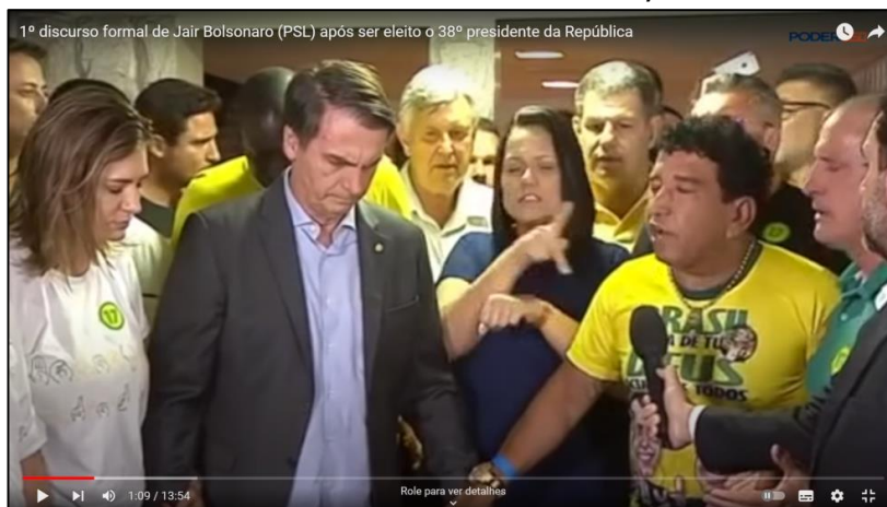
Figura 02 Discurso de vitória de Bolsonaro, 2018