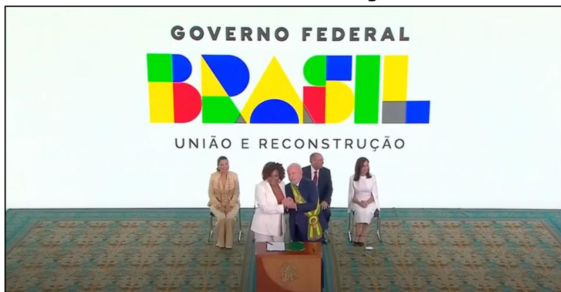
Figura 08 Posse da Ministra da Cultura Margareth Menezes