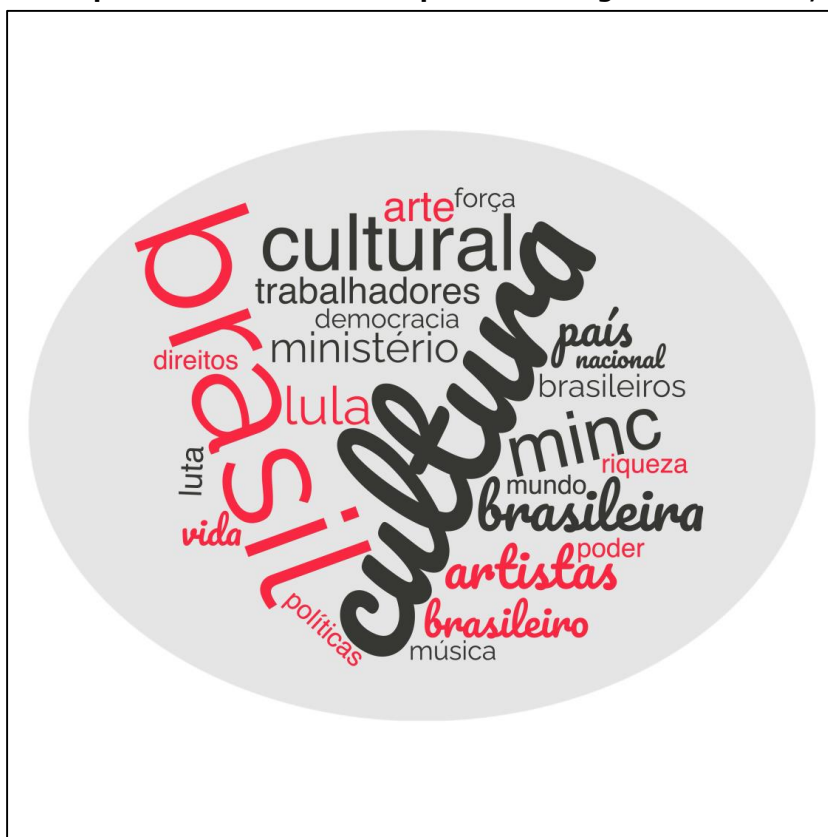
Figura 10 Nuvem de palavras do discurso de posse de Margareth Menezes, 2023