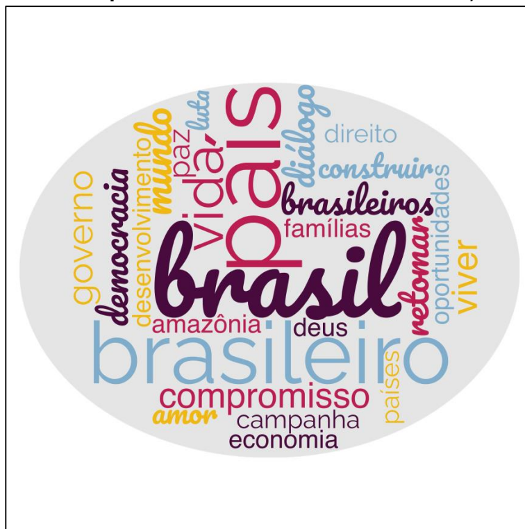
Figura 07 Nuvem de palavras do discurso de vitória de Lula, 2022