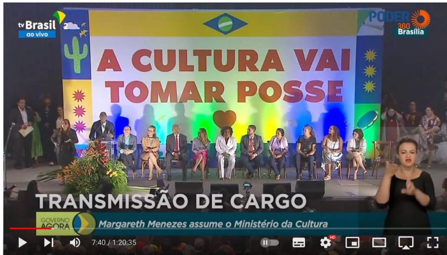
Figura 11 Cerimônia de transmissão de cargo do Ministério da Cultura