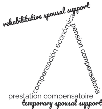
GRÁFICA 1. DENOMINACIONES DE LA PRESTACIÓN COMPENSATORIA EN EL DERECHO FORÁNEO

Ahora bien, no deben confundirse estas herramientas patrimoniales cuyo objetivo es la compensación material a la sobreinversión que realizan de manera más recurrente las mujeres en el hogar o en la carrera de su cónyuge, a costa del sacrificio de su desarrollo profesional 46 , con una indemnización de perjuicios en virtud de la producción de un daño en el escenario de la