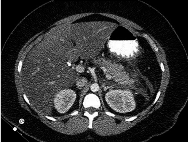
Figura 1. TAC de abdomen con doble contraste. Se evidencia colección definida peripancreática, principalmente hacia la cola del páncreas compatible con Baltazar D.