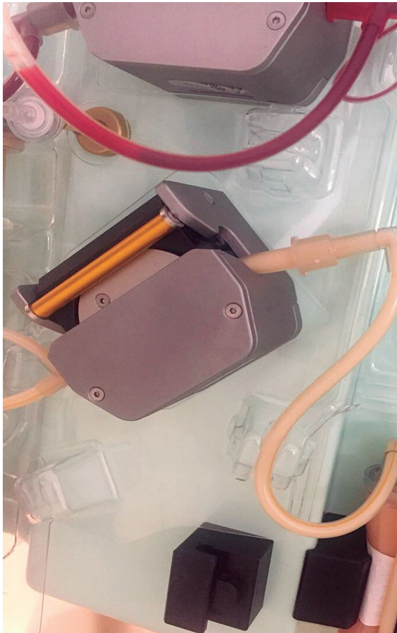
Figura 3. Se muestra proceso y resultado de plasmaféresis inicial de paciente, con pancreatitis severa por hipertrigliceridemia.

drenaje de 700 mL de líquido peritoneal seroso sin evidencia de signos de esteatonecrosis. Durante el procedimiento no se realizó la exploración de transcavidad de epiplones y se dejó el abdomen abierto con sistema de presión negativa.