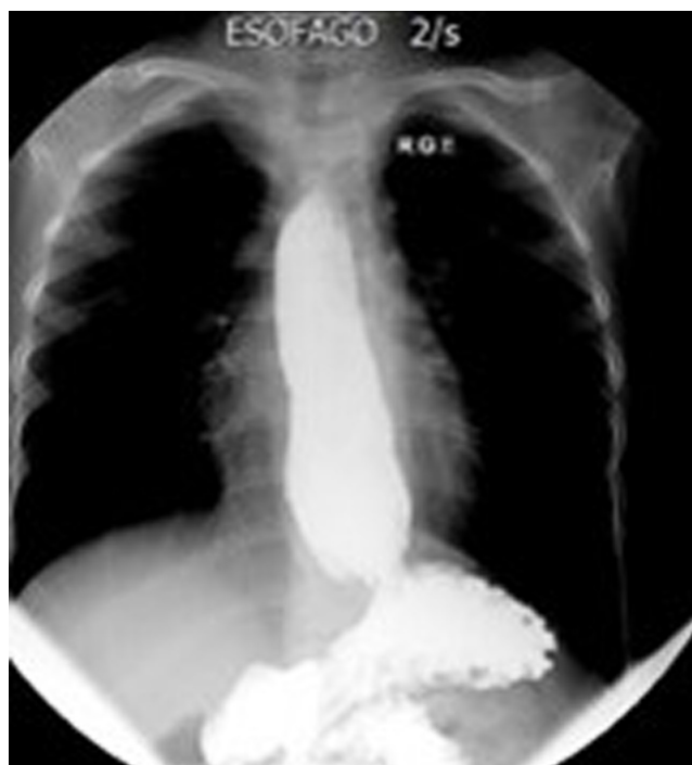
Figura 2. Radiografía de las vías digestivas altas, con aumento del diámetro del esófago, reflujo severo y alteración del peristaltismo con ondas terciarias.

ción de los Ángeles), un pólipo hiperplásico, una hernia hiatal pequeña, antro con gastritis folicular y un duodeno normal ( Figura 3 ).