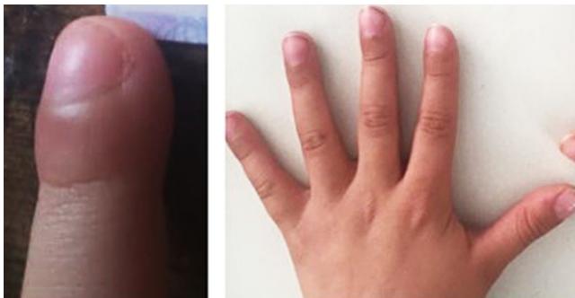
Figura 1. Hipocratismo digital documentado inicialmente (izquierda), y en mejoría posterior al tratamiento insaturado (derecha).

Además, asociado a la anemia, apareció el hipocratismo digital en ambas manos ( Figura 1 ), así como hipoalbuminemia (3 g/dL) y desnutrición crónica agudizada. En vista de este cuadro, fue valorada fuera de la institución por neumología, hematología, reumatología y genética, con múltiples estudios por cada especialidad, sin encontrarse la causa.