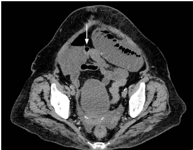
Figura 1. Obstrucción intestinal con zona de transición en el íleon distal. Tomografía simple de abdomen, con una flecha que señala la zona de transición, con estenosis en el íleon distal.

Se trata de una paciente femenina de 88 años con antecedente de cáncer de cérvix manejada con radioterapia, con un cuadro clínico de una semana de dolor abdominal generalizado, asociado a episodio de náuseas y vómito, con intolerancia a la dieta y deposiciones diarreicas intermitentes. Al ingreso se realizó una tomografía axial computarizada (TAC) de abdomen simple, por tener antecedentes de reacción anafiláctica al medio de contraste, y se evidenció una obstrucción intestinal con una zona de transición a nivel del íleon distal ( Figura 1 ). Se programó para laparotomía exploratoria al considerarse una obstrucción primaria, que se realizó ese mismo día, y se encontraron tres segmentos consecutivos y progresivos de estenosis circunferencial, en una longitud de 15 cm, que condicionan la presencia de una zona de transición, y se consideró inicialmente que podrían corresponder a efectos secundarios a la radioterapia que había recibido. Ante estos hallazgos, se decidió realizar una resección y anastomosis del segmento, procedimiento que no tuvo complicaciones. La paciente evolucionó de manera satisfactoria, con tolerancia a la vía oral progresiva (líquidos claros, líquida completa, blanda y sólida) y presencia de deposiciones, por lo cual fue dada de alta.