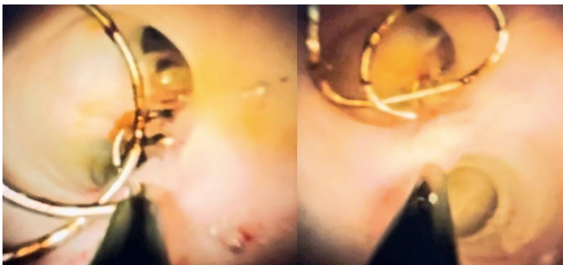
Figura 2. Visión endoscópica de la vía biliar y coils en su interior empleando el sistema Spyglass®.

y fístula biliar que requirió CPRE e inserción de stent en el posoperatorio mediato, además de hemobilia con repercusión hemodinámica secundaria a pseudoaneurisma de la arteria hepática derecha que requirió una embolización