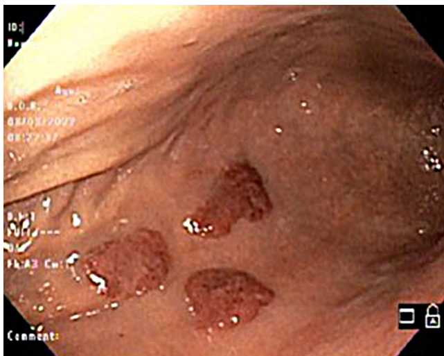
Figura 2. Lesión nodular, hiperpigmentada.

den tener otras causas diferentes a SK-GI en el contexto de inmunosupresión grave e infección por VIH. Por otro lado, se observó una alta ocurrencia de SK con manifestaciones cutáneas entre aquellos con afectación gastrointestinal, hallazgo similar al evidenciado por otros autores (8,13) .