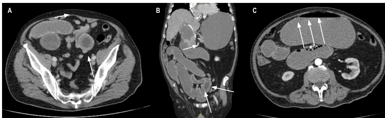
Figura 1. A y B. Imagen en diana de tomografía abdominal sugestiva de obstrucción intestinal por intususcepción. C. Imagen de collar de perlas sugestiva de obstrucción intestinal.

El diagnóstico se realiza mediante imagen de radiografía, ecografía o tomografía abdominal. En la radiografía se observan neumobilia o signo de gotta-Mentschler, distensión de las asas intestinales y cálculo radiopaco (tríada de Rigler) patognomónica de la enfermedad cuando se presentan por lo menos 2 de los criterios, aunque solo se