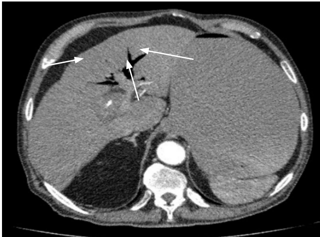
Figura 2. Imagen de neumobilia intrahepática.

encuentra en 15%-53% de los casos, que se convierte en la tetrada de Rigler cuando se encuentra un cambio de posición de los cálculos en radiografías seriadas; adicionalmente, si se realiza una radiografía con medio de contraste, se describen el signo de Forchet (intestino con silueta en forma de serpiente rodeada por un halo de cálculos radio-