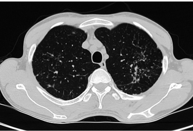
Figura 1. Tomografía (TAC) de tórax con presencia de cambios fibrocatrictoriales en el lóbulo superior izquierdo con tractos pleuroparenquimatosos, bronquiectasias por tracción y presencia de micronódulos.

El cuadro clínico inició posterior a un trauma de tórax debido a un accidente de tránsito. Se realizó una tomografía de tórax cuyo hallazgo incidental fue una fibrosis apical sugestiva de tuberculosis (TB). No presentaba síntomas respiratorios, y debido a los hallazgos en la imagen fue llevado a un lavado broncoalveolar con detección de XpertMTB/RIF para TB. Se decidió iniciar el tratamiento tetraconjugado con rifampicina/isoniazida/pirazinamida/etambutol (RHZE), y se completó la primera fase con control de baciloscopias negativas ( Figura 1 ).