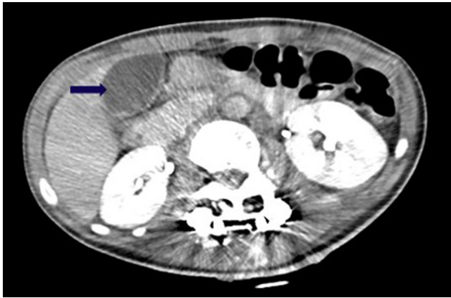
Figura 2. Tomografía axial computarizada (TAC) de abdomen contrastado. La flecha indica persistencia de hallazgos compatibles con adenomiomatosis vesicular, un discreto aumento del diámetro anteroposterior de la cola y grasa peripancreática conservada con aumento perivesicular.

dad de la vesícula biliar, relativamente muy rara en niños, que implica colecistitis y colelitiasis (3,5) . Hasta el momento, es una afección sumamente infrecuente, de la cual no se conoce su patogenia ni las indicaciones para cirugía, especialmente en la población pediátrica. En adultos se observa en el 5% de las muestras obtenidas durante la colecistectomía (3,6) . Hasta el 2020 se han descrito solo diez casos de esta enfermedad en niños (3) .