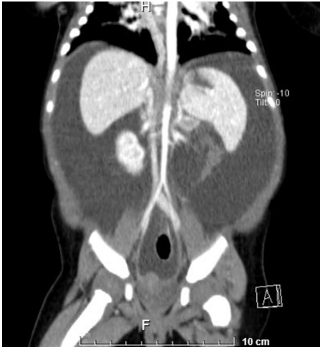
Figura 1. TAC trifásica de abdomen. Hígado y bazo con parénquima homogéneo, páncreas con patrón de atenuación tisular, riñones normales, ascitis espontánea más atelectasia subsegmentaria posterobasal pulmonar bilateral y ausencia de tumores identificables.

por lo que se inició una infusión de octreotida a 1 µg/kg/h y NPT. Se mantuvo dicha infusión al inicio y posteriormente con ascitis refractaria; se aumentó la dosis hasta 3 µg/kg/h. Se realizaron varias paracentesis evacuatorias con drenaje de volúmenes de hasta 900 mL y