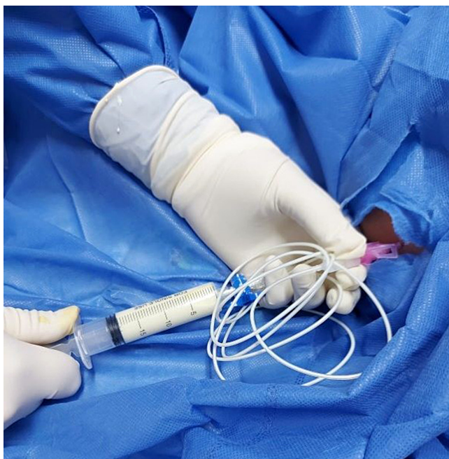
Figura 4. Paracentesis en la que se evidencia la extracción de líquido ascítico de aspecto quiloso.

Aunque se han propuesto varios métodos para investigar la LIP, ninguno de ellos puede reemplazar el examen histológico de biopsias para confirmar el diagnóstico (2) . Sin embargo, exámenes de imagen de rutina al inicio, como el ultrasonido abdominal y la tomografía abdominal, pueden identificar típicamente un engrosamiento difuso de la pared del intestino delgado y un edema, que son consecuencia de los vasos linfáticos dilatados dentro de las vellosidades (2) .