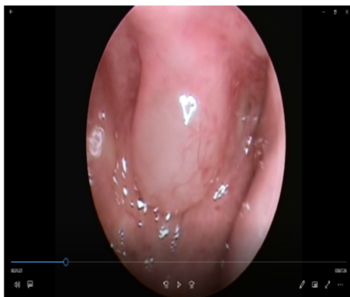
Figura 3. Tumoración en nasofaringe, visión por endoscopia nasal.