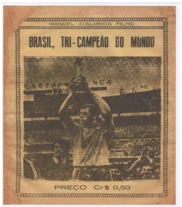
Figura 2 – Capa do folheto de Manoel D’Almeida Filho

D'ALMEIDA FILHO, 1970 - Acervo da Fundação Casa de Rui Barbosa.