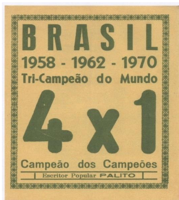
Figura 1 – Capa do folheto de Severino Manuel (Palito)

PALITO, 1970 - Acervo Raymond Cantel, Universidade de Poitiers, França.