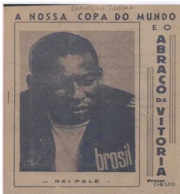
Figura 5 – Capa do folheto de Carolino Leóbas

LEÓBAS, 1970 - Acervo Raymond Cantel. Universidade de Poitiers, França.