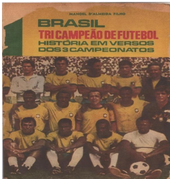
D’ALMEIDA FILHO, [1970?] - Acervo da Fundação Casa de Rui Barbosa

O que chamou a atenção, no que diz respeito ao conteúdo, foi que, diferente da publicação anterior, na qual o silêncio sobre Médici foi sintomático, agora o ditador-presidente ganhou destaque. Depois de longas descrições em sextilhas de cada jogo vencido pela seleção brasileira nas duas primeiras Copas, o bardo paraibano republicou alguns trechos do folheto anterior e fez acréscimos significativos. Assim registrou D’Almeida Filho ([1970?], p. 27-28, grifos nosso),