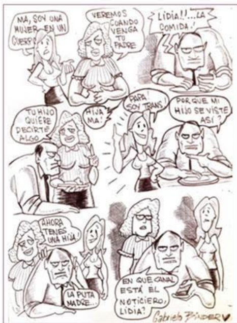
Figura 7 - Chica trans por Gaby Binder