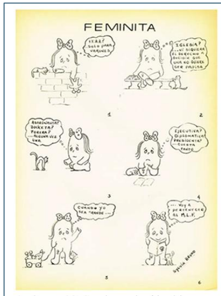
Figura 05 - “Feminista” por Sylvia Bruno

Fuente: BRUNO, Sylvia (1974) en Nosotras contamos (Acevedo, 2019b p. 28)