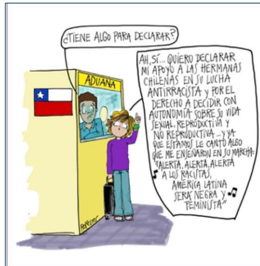
Fuente: FERRER (Facebook, 2018) en Nosotras contamos (Acevedo, 2019b p. 64)