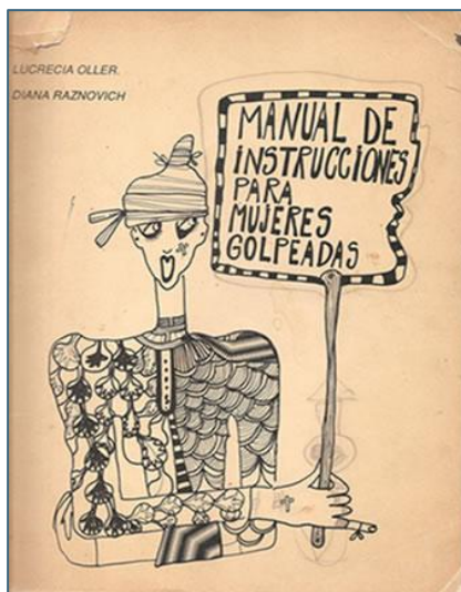
Figura 03 - Ilustración de portada del Manual de Instrucciones para mujeres Golpeadas (Lugar de Mujer, Buenos Aires, 1989) Diana Raznovich y Lucrecia Oller.