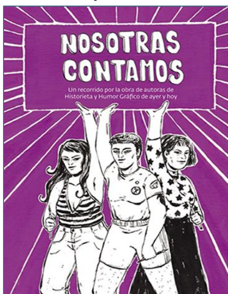
Figura 01 - Portada de libro catálogo: Con ilustración de Femimutancia, (seudónimo de la artista Julia Inés Mamone) y diseño editorial de Daniela Ruggeri

Fuente: (MAMONE, 2019). Portada, de Nosotras contamos . Acevedo, M (2019b)