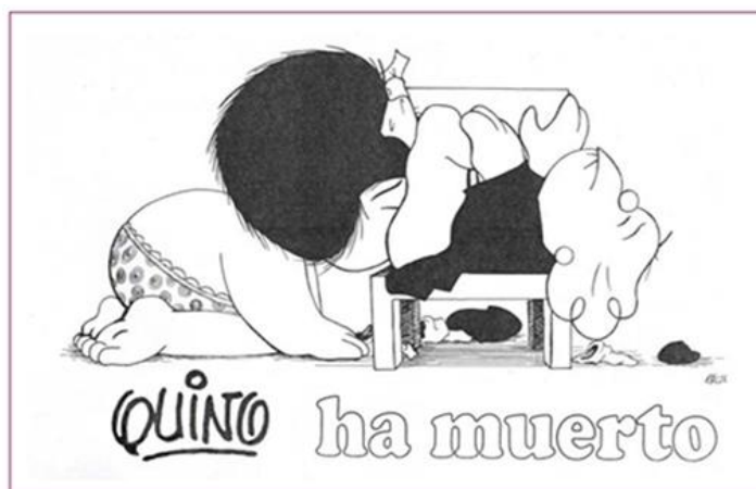
Figura 06 - Alyen parte de una genealogía feminista que incluye a personas no binarias.

La viñeta fue publicada en revista Baruyera 7 (julio 2009) generando polémicas en redes sociales hasta la actualidad.