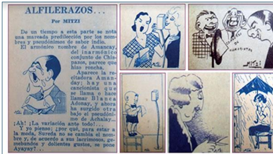
Selección de ilustraciones de Mitzi.

Figura 02 - Las viñetas firmadas por Mitzi (más conocida por el seudónimo de actriz cómica de radioteatro, "Nini Marshall") ilustraban su mordaz columna sobre espectáculos en la Revista Sintonía año (1933). Allí, la dibujante y escritora criticaba a colegas, opinaba sobre la participación de las mujeres en los medios de comunicación y mostraba su versatilidad para hacer humor en distintos soportes.