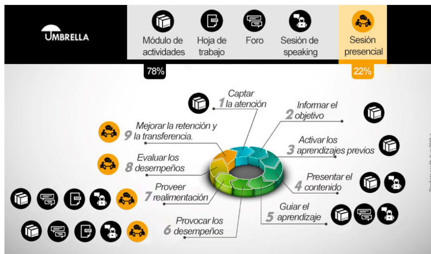
Figura 2. El modelo de enseñanza-aprendizaje híbrido-invertido.

eventos seis al nueve, en los que se provocan los desempeños, el docente provee realimentación y tienen lugar la evaluación formativa y las oportunidades de interacción entre pares (ver figura 2).