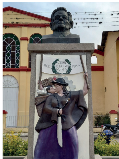
Figura 5. Monumento a Juan de la Cruz Varela en la plaza central de Cabrera (Cundinamarca)

En el municipio de Cabrera –que forma parte de la región del Sumapaz– se encuentra el busto de Juan de la Cruz Varela, el reconocido líder agrario que decidió liderar la resistencia armada campesina frente a la violencia promovida por el Estado. El monumento lo complementa la figura de una mujer campesina que sostiene un machete mientras le da un beso al hijo que carga en su espalda: trabajo, amor y resistencia en su más simple expresión. En este municipio decidió asentarse luego de entregar las armas en 1957, y desde aquí siguió liderando el movimiento agrario hasta su desaparición física, en 1984, con 82 años. En un país donde abundan las estatuas de Bolívar, el monumento es excepcional ya que se trata del único que rinde homenaje a un líder guerrillero en Colombia, en este sentido bien puede considerarse un ejemplo de monumentalización de una memoria de resistencia (figura 5).