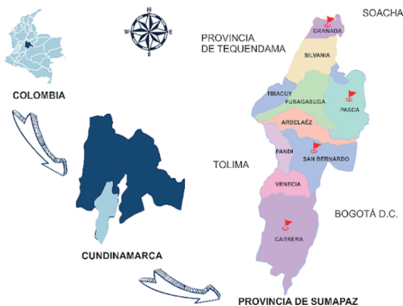
Figura 3. Región del Sumapaz

Nota: tomado de Albarracín et al. (2019).