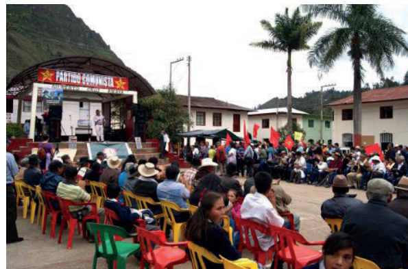
Figura 6. Acto de homenaje a la memoria de Juan de la Cruz, en Cabrera (Sumapaz) (enero 2015)

la influencia del Partido Comunista Colombiano es evidente y su tradición se remonta a las luchas agrarias que encabezó Juan de la Cruz Varela (figura 6). Debido a ello, la población civil de la región sufrió el ensañamiento del Ejército durante los años de las operaciones militares de 2002-2006, lo que se evidenció en bombardeos, hostigamientos, asesinatos, falsos positivos judiciales, torturas, empadronamientos, entre otras violaciones graves a los derechos humanos (Semana Voz, 2017). El caso del monumento Héroes del Sumapaz es una muestra de la lucha entre una memoria hegemónica representada en el relato militar/heroizante del Ejército Nacional y una memoria subalterna cuya voz es la del movimiento agrario de los campesinos del Sumapaz. Así, la memoria hegemónica es entendida como aquella visión del pasado que logra consenso y otorga legitimidad a las clases privilegiadas, a sus intereses, acciones e ideología; mientras que la memoria subalterna expresa el pasado desde su propia perspectiva de clase que incluye la incorporación y aceptación relativa de la relación de mando/obediencia y, al mismo tiempo, desarrolla acciones de resistencia y negociación permanente (Modonesi, 2010). Esta contraposición hegemonía/subalternidad constituye el campo de lucha por el dominio cultural cuyo propósito final es la conformación de legitimidad y sentido social.