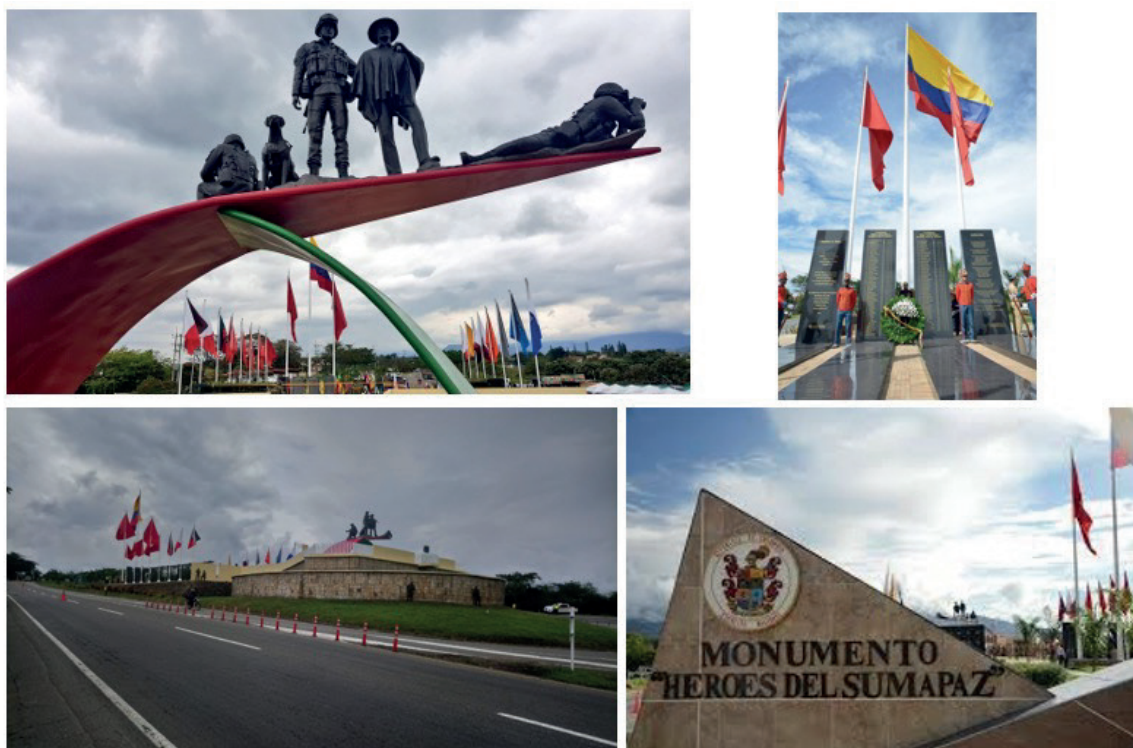
Figura 4. Monumento “Héroes del Sumapaz”

El monumento cuenta con acompañamiento permanente del Ejército Nacional y existen guías de esta institución que acompañan a los visitantes, a quienes les exponen el relato histórico y les explican la simbología del lugar. El discurso patriótico grandilocuente que enaltece al Ejército es recurrentemente tanto por los guías como por los documentos que describen el monumento: