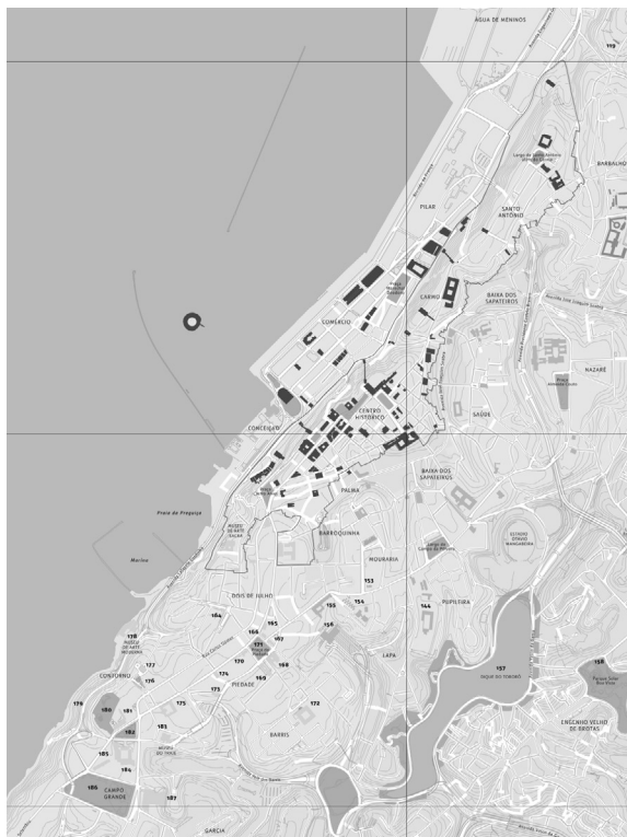
Mapa 3 - Cidade Alta e Cidade Baixa, com a área patrimonializada definida pela UNESCO, com o Centro Histórico marcado em contorno contínuo