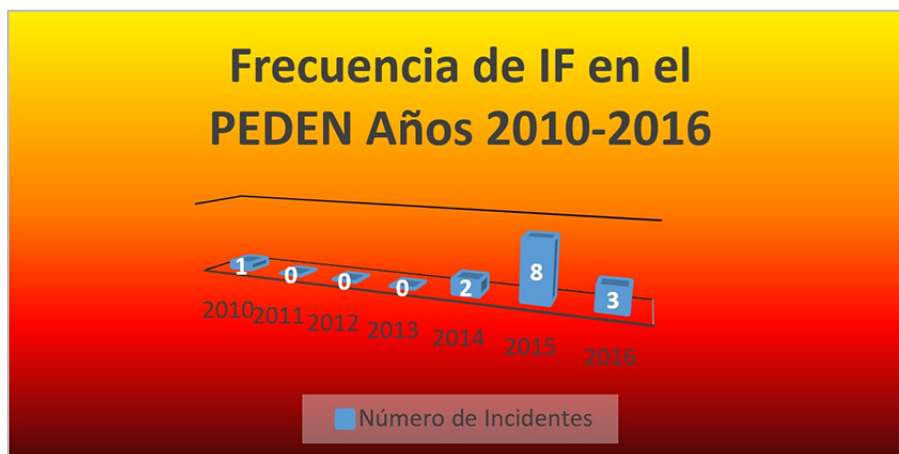
FIGURA 1. Frecuencia de incendios forestales en el Peden, años 2010-2016