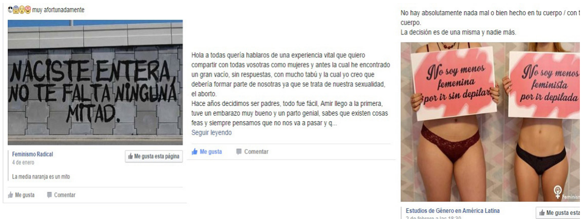
Figura 3. Postagens realizadas por alguns membros da comunidade Mujeres en Círculo.