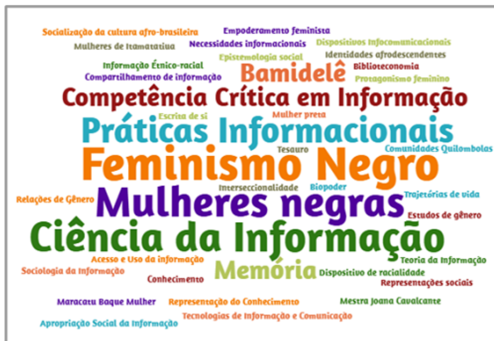
Figura 1 Nuvem de tags com as palavras-chave utilizadas