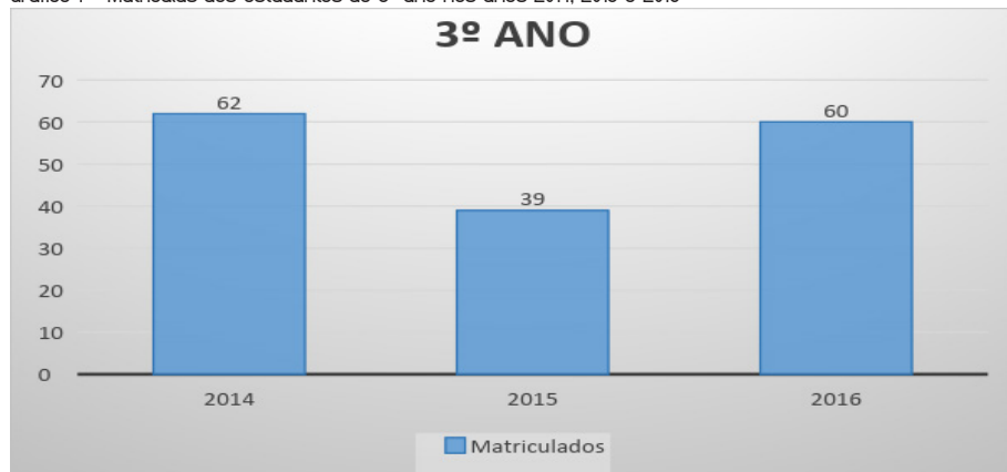
Gráfico 1 - Matrículas dos estudantes do 3º ano nos anos 2014, 2015 e 2016

No que tange ao ingresso dos estudantes no terceiro ano do curso de Magistério, ou primeiro ano para aqueles que já terminaram o Ensino Médio, os dados cedidos pela secretaria da instituição mostram que, em 2014, foram matriculados 62 estudantes. No ano seguinte, 2015, 39 e em 2016 60 estudantes. Como demonstra o gráfico a seguir: