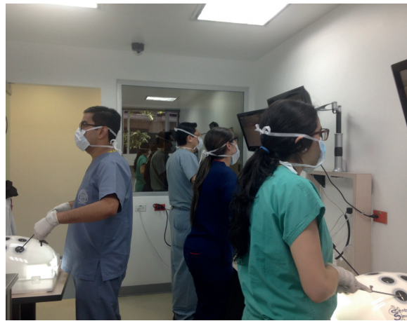
Figuras 1 y 2. Laboratorio de simulación quirúrgica Pontificia Universidad Javeriana. Bogotá DC, Colombia.