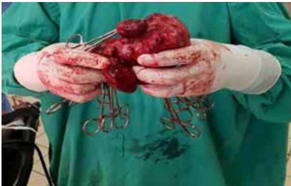
Figura 3. Se muestra la pieza de exéresis quirúrgica.