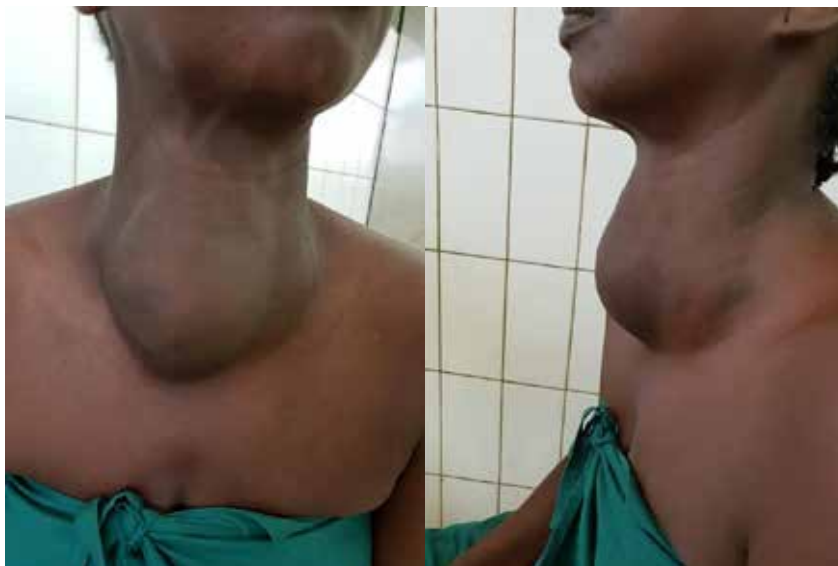
Figura 1. Vista frontal y lateral de la paciente en consulta externa.

La paciente recibe tratamiento postoperatorio con hidratación parenteral con solución polielectrolítica, analgésicos, antimicrobianos y esteroides a dosis bajas. Se recupera y evoluciona de manera satisfactoria, y se da alta hospitalaria a los 8 días del postoperatorio. En el seguimiento de la paciente, en consulta externa, no se identificaron complicaciones postoperatorias. Se recibe el informe anatomopatológico que corrobora la presencia de bocio multinodular con áreas de calcificación.