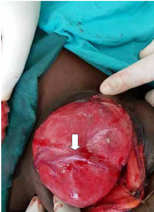
Figura 2. Vista del sitio operatorio. Obsérvese la amplia vascularización de la glándula (flecha blanca).