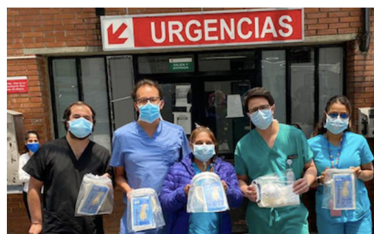
Hospital Simón Bolívar

Mientras íbamos organizando los equipos, se hicieron los contactos con los directores de las cuatro sub-redes de Bogotá y pudimos hacer la entrega de los equipos para el personal de los hospitales El Tunal, Fontibón, Simón Bolívar y Santa Clara.