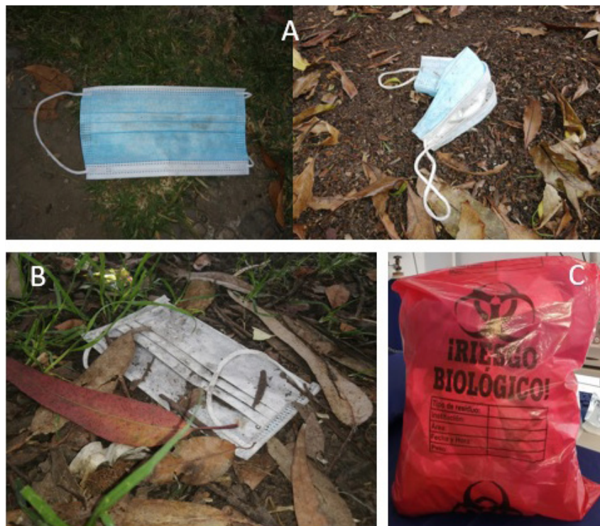
Figura 2. Incremento en residuos plásticos. A-B, tapabocas desechados de forma inadecuada en el medio ambiente. C, incremento en volumen de residuos en unidades sanitarias.

El “Convenio de Basilea sobre el control de los movimientos transfronterizos de desechos peligrosos y su eliminación incluyendo el manejo de los desechos plásticos”, se suscribió el 22 de marzo de 1989 y empezó a regir el 5 de mayo de 1992, siendo ratificado en 2019 por 180 países 21 . Este Convenio fue aprobado en Colombia mediante la ley 253 de 1996 y es el primer y único tratado internacional relacionado con desechos peligrosos del cual hacemos parte.