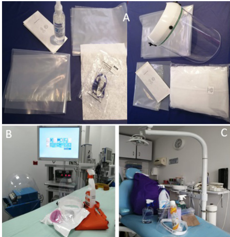
Figura 1. Incremento y generación de nuevos insumos por la pandemia COVID-19. A, Caretas, plásticos de protección, alcohol, vestidos desechables en unidades de endoscopia. B, Desinfectantes, delantales y filtros en unidades quirúrgicas. C, Caretas, mezcladores, petos, desinfectantes en unidades odontológicas.

interna que es un material fibroso, una intermedia o de filtro y una exterior resistente al agua. La capa principal, intermedia o de filtrado, está fabricada con nano o microfibras dependiendo del tamaño de la partícula a filtrar 4 .