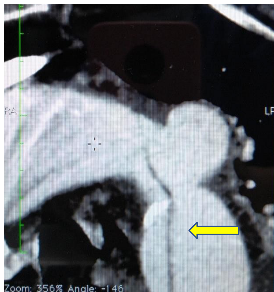
Figura 6. Angiotac con úlcera aortica y disección.

Se hizo embolización de la arteria subclavia izquierda con dos coils de platino de 12 mm por 40 mm (Boston Sci. Corp. USA), logrando la exclusión completa de la lesión, sin endofugas (figura 8).