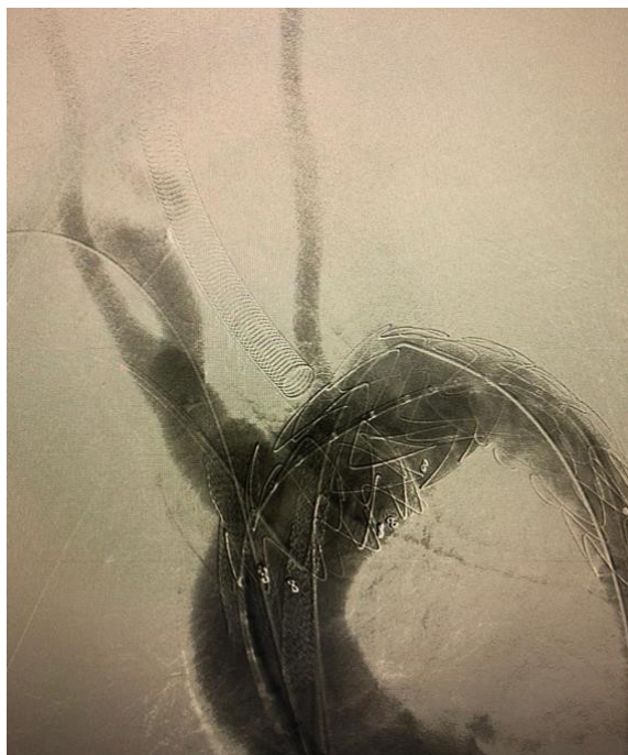
Figura 8. Exclusión completa del aneurisma y revascularización endovascular de la carótida izquierda y del tronco braquiocefálico.