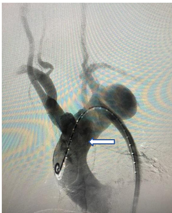
Figura 7. Angiografía sin zona de anclaje proximal.