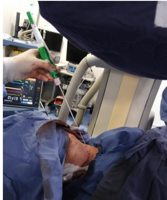
Figura 5. Cierre percutáneo con Angioseal.