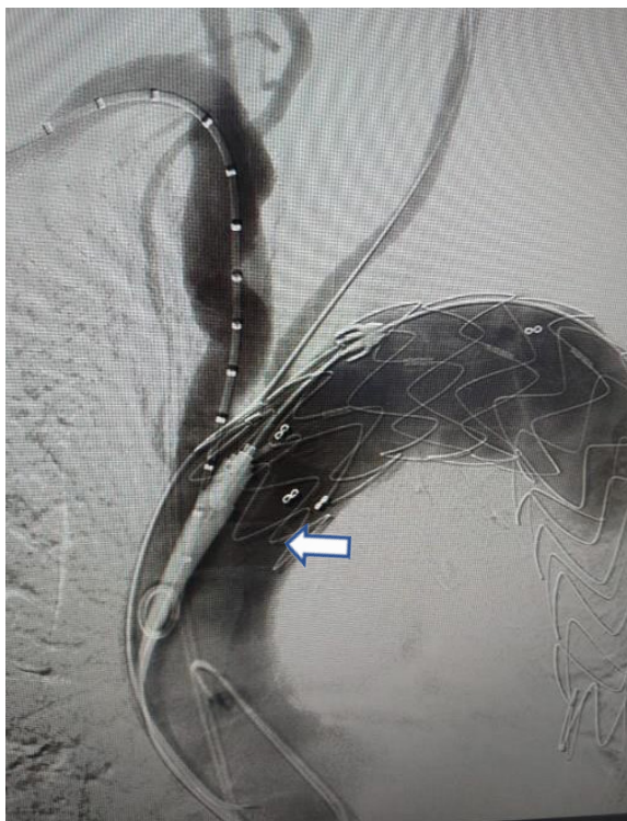
Figura 4. Exclusión completa del aneurisma y permeabilidad de la arteria carótida.