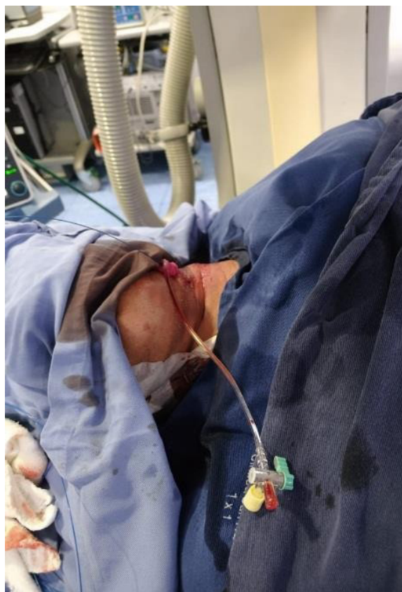
Figura 2. Abordaje percutáneo de arteria carótida común izquierda.

El paciente se trasladó a la unidad de cuidados intensivos, donde permaneció por cuatro días. El control tomográfico 48 horas luego del procedimiento confirmó la desaparición del aneurisma y la ausencia de fugas. Posteriormente permaneció cinco días más en hospitalización general, sin presentar eventos cerebrovasculares, ni complicaciones hemorrágicas o trombóticas a nivel cervical, fue dado de alta al décimo día post quirúrgico.