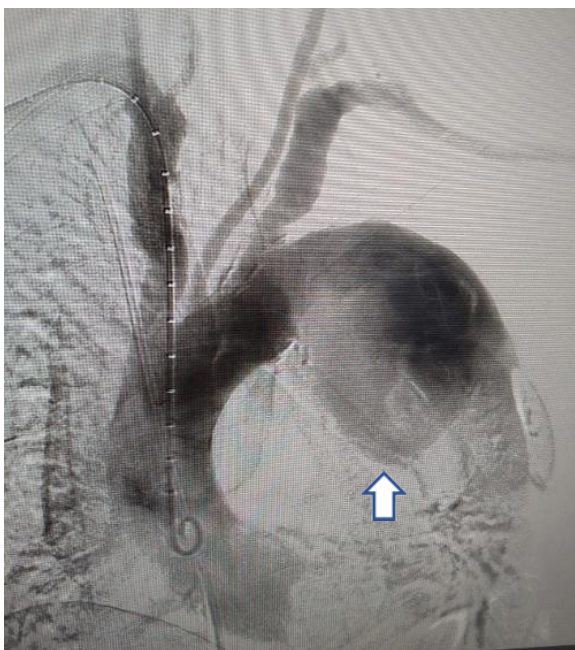
Figura 1. Aneurisma del arco aórtico roto, sin zona de anclaje proximal.

Por esta misma vía se avanzó una guía hidrofílica de 0,035 pulgadas (Terumo corporation, Hatagaya, Tokio) hasta la aorta ascendente y sobre ella se pasó una endoprótesis Medtronic Valiant Captiva®, de 34 mm por 20 cm (Medtronic, Parkway, Minneapolis, USA), que se liberó sin complicaciones, cubriendo el ostium de la arteria carótida común izquierda. Inmediatamente se cambió el introductor 4 por uno de 7 french