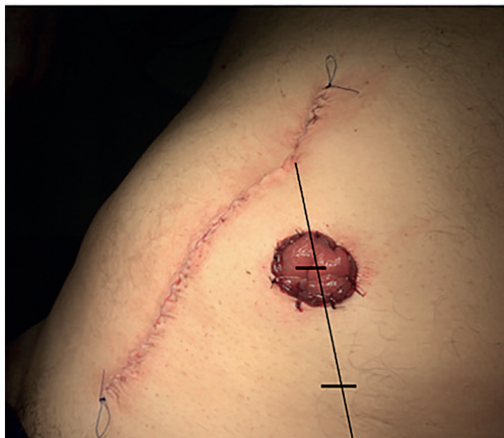
Figura 1. Marcación adecuada del sitio del estoma.

Frente a este aspecto, algunos autores establecen como altura mínima 20 mm en las ileostomías y 5-7 mm en las colostomías 3,7,8 , con el fin de reducir las complicaciones, especialmente aquellas que comprometen la piel; otros estudios han demostrado que un estoma de menos de 10 mm es un factor de riesgo para la aparición de complicaciones 1 .