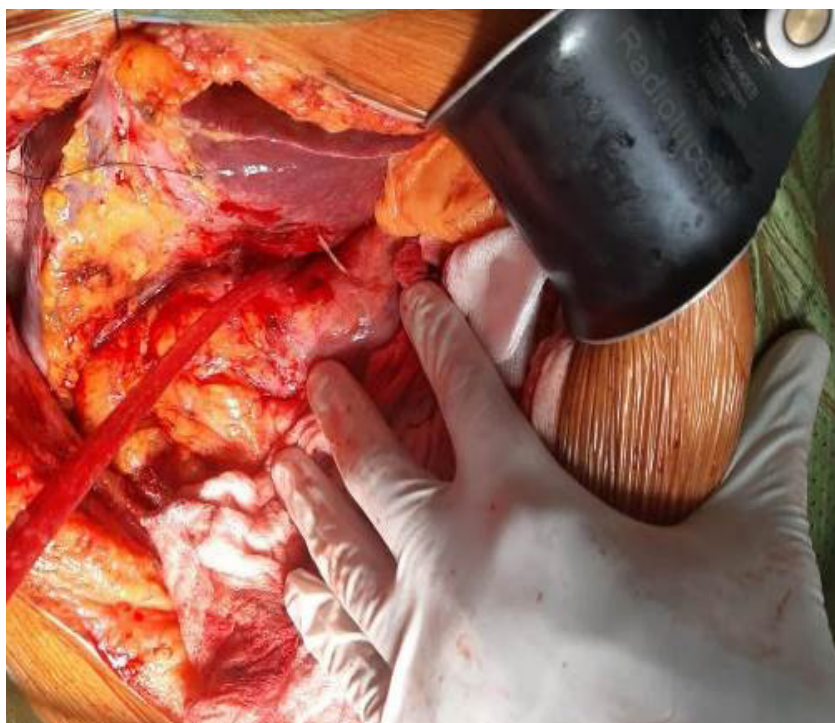
Figura 3. Hallazgo intraoperatorio donde se aprecia el cuerpo extraño, que perfora desde el antro gástrico hacia el lóbulo hepático izquierdo, señalado por la flecha blanca.