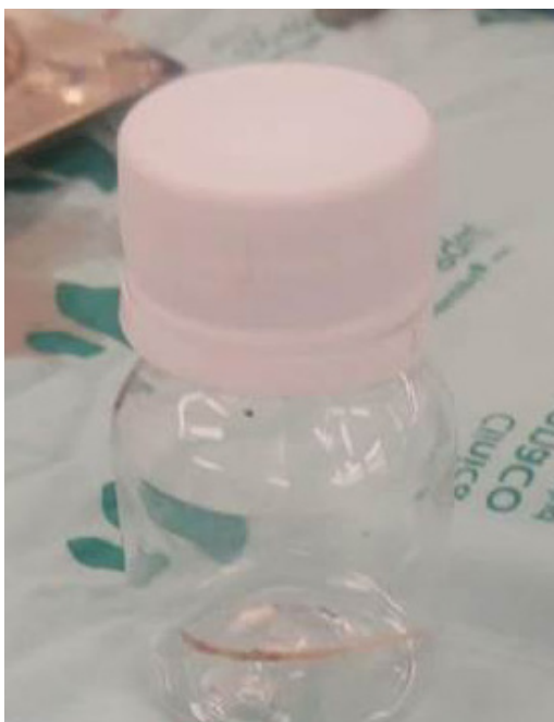
Figura 4. Cuerpo extraño, correspondiente a espina de pescado.

vómito o pérdida de peso 4 . En nuestro caso, el paciente se presentó con un cuadro clínico diferente, lo cual dificultó y retrasó el diagnóstico.