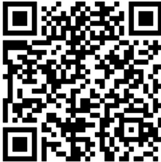
Fig. 2. QR Code para acesso ao episódio na íntegra

O episódio foi idealizado tendo como ideia principal a inserção dos conteúdos que os alunos do quinto ano devem aprender e que são medidos na Prova Brasil.