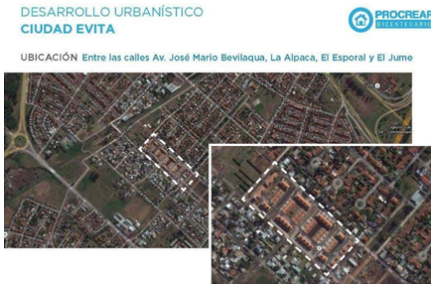
Figura 3. Localización. Desarrollo Urbanístico PRO.CRE.AR Ciudad Evita