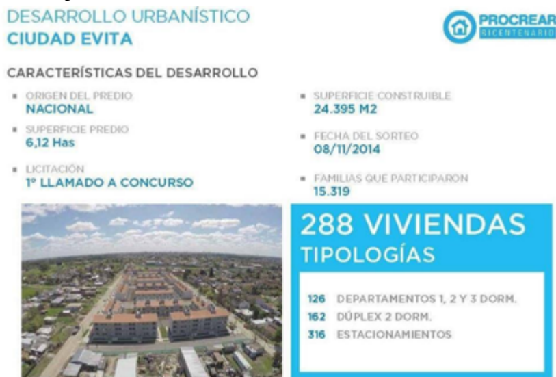
Figura 2. Desarrollo urbanístico PRO.CRE.AR Ciudad Evita